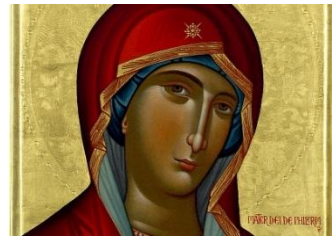
"Muttergottes von Philermos, Patronin der Malteser"

Wir bitten um Anmeldung bis spätestens 14. Mai.